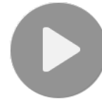
Annesi ölen yavru köpeğe keçi annelik yapıyor Sıradaki Haber Aksaray'da insanlık ayıbına soruşturma Türkiye Haber Giriş: 7 Kasım 2019 Perşembe 10:36